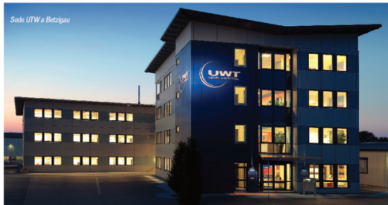
Sede UWT a Betzigau

Si rafforza sempre di più il legame fra le due realtà: l'azienda tedesca in forte crescita è specializzata in misure di livello per prodotti solidi e liquidi