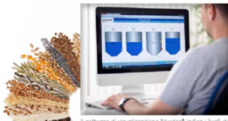
Il software di visualizzazione Nivotec® indica i livelli dei silo in tempo reale sul PC dell'operatore