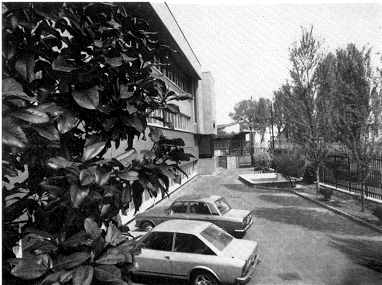
Vista dall'esterno della Sede della SMERI.

nel cliente e capire così l'importanza del problema che ci presenta. La conferma di ciò l'abbiamo sempre ogni giorno, dal modo con il quale le nostre affermazioni vengono tenute in considerazione dai nostri clienti.